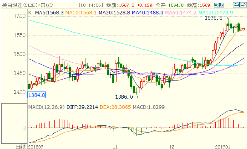
图 2：COMEX 白银主力合约技术分析