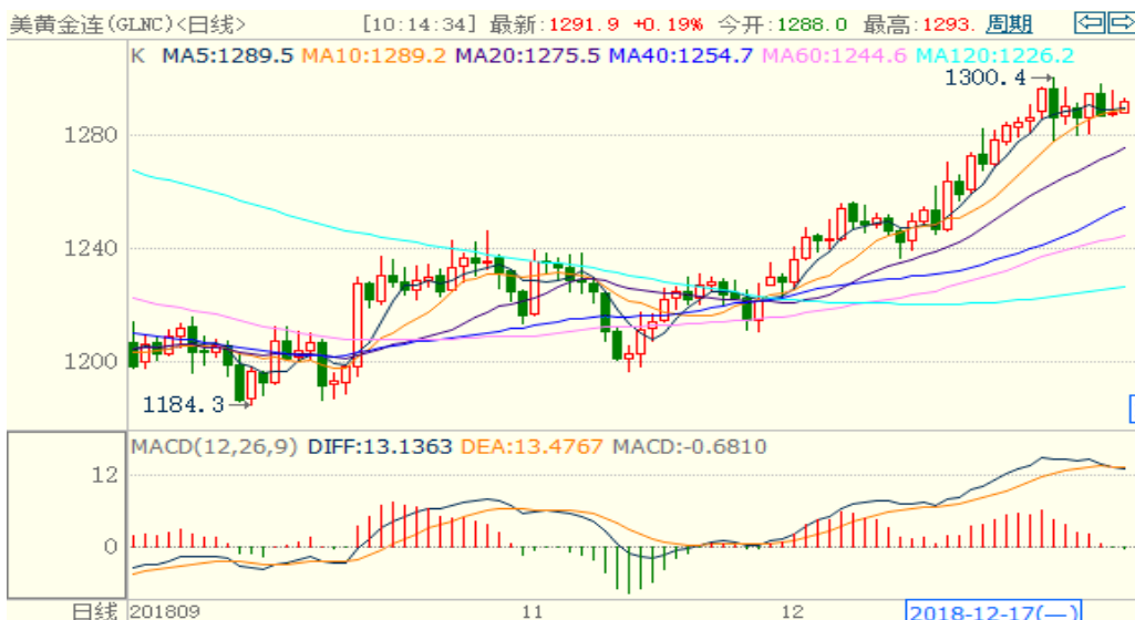
图 1：COMEX 黄金主力合约技术分析

COMEX 黄金上周维持横盘震荡，技术指标偏空，本周预计 COMEX 黄金将震荡下跌。上周因人民币大幅升值，沪金大幅下跌，预计本周人民币升值较难持续，国内黄金跌幅受限。